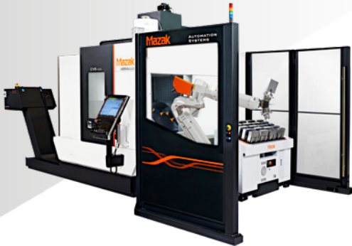
CV5-500 mit Mill Assist

Wir präsentieren unser Angebot an Automationslösungen für jeden Maschinentyp und jede Anwendung. Von einfacher roboterbasierter Maschinenbestückung über komplexe 5-Achsen-Werkstückhandhabungs- und Aufspannsysteme.